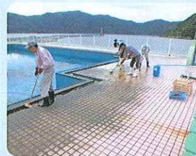
プール清掃の様子 (瀬戸地区)