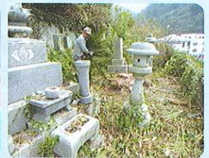
お墓掃除の様子 (三崎地区)