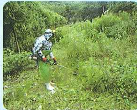
草刈り作業の様子 (伊方地区)