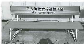
町内での使い道 公園等へのベンチ設置など