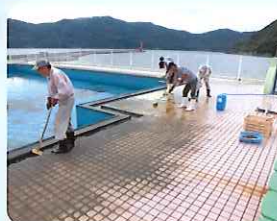
プール清掃の様子 (瀬戸地区)