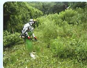
草刈り作業の様子 (伊方地区)