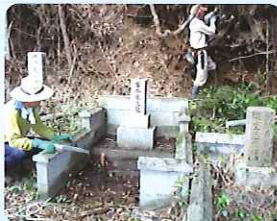
お墓掃除の様子 (瀬戸地区)