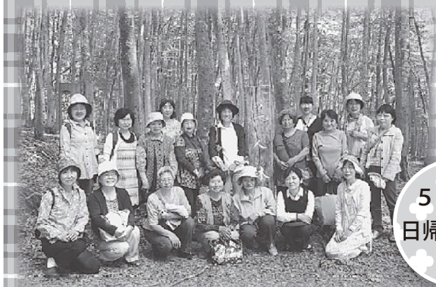
松之山 美人林 散策

刈羽村の委託を受け、在宅で介護をしている方々の心身のリフレッシュや仲間作り、介護情報の交換の場として定期的を開催しています。