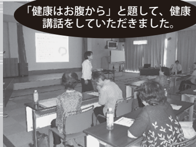
「健康はお腹から」と題して、健康講話をしていただきました。