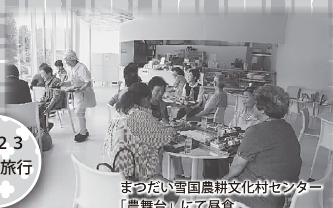
まつだい雪国農耕文化村センター 「農舞台」にて昼食