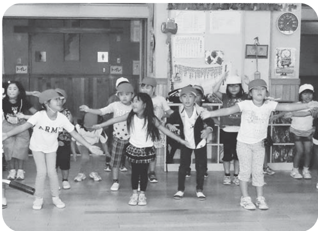
▲かわいいダンスでスタート!会場内が一気に賑やかに♪

宮崎小学校1・2年生の皆さんが、9月12日に宮崎デイサービスセンターへ遊びに来てくれました。