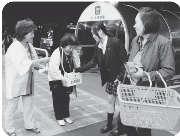
▲今年も皆様のご協力をよろしくお願いします!