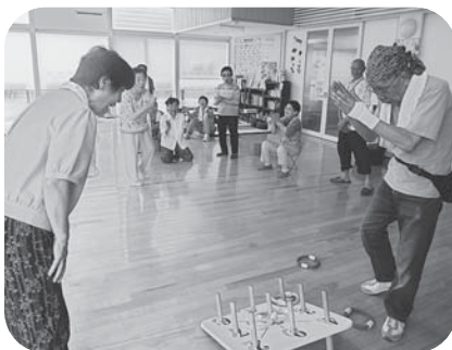
▲思った以上に難しい『輪投げ』。狙い通りの一投に拍手!(中新田城内)