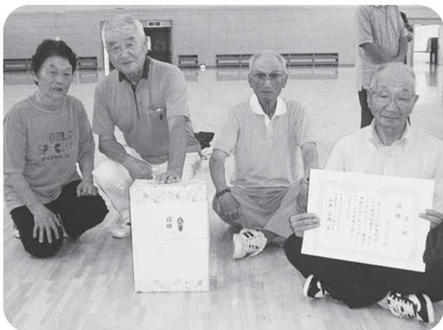
▲見事に初優勝を果たした寿の会（宮崎地区老連）の皆さん

8月25日、加美町総合体育館を会場に、第12回加美町老連ペタンク大会が開催されました。当日は各地区大会を勝ち抜いた24チーム・約120名の会員が参加し、10月12日に大郷町で開催される宮城県シニアスポーツ大会の代表を目指し、熱戦を繰り広げました。