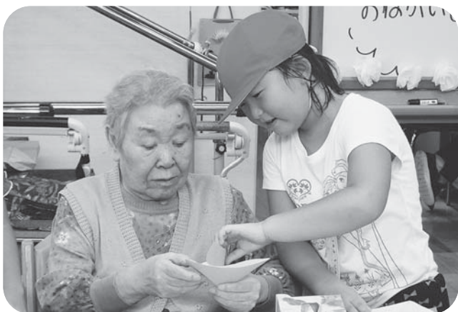
▲「ここはどうすんの?」「おばあちゃん、ここを開いて…」一緒に折り紙で様々な形を作ります。