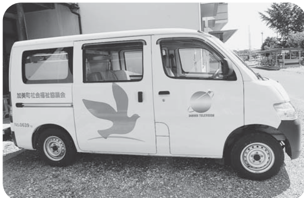
▲24時間テレビチャリティー委員会様より寄贈された入浴車で、利用者様のご自宅へ伺います。