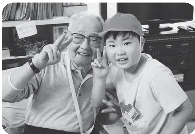
▲子どもたちからメダルをかけてもらってニコリ♪二人そろってカメラにVサイン!!