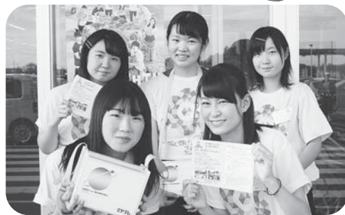
▲2年・3年と続けて参加された方も！ 今年もありがとうございました!!▼

集まった募金は宮城テレビを通じて、福祉・環境・災害援助等に活用されます。今年も皆様のあたたかいご協力、大変ありがとうございました。