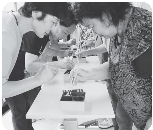
▲「ツルツルしてつかめねごだ！」(豆つかみゲーム)

遊び方：2人1組になり、紐を前後に操作して馬をゴールへ進めます。息を合わせて早くゴール側に到着したチームの勝ちです。