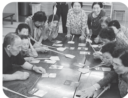
▲『はいっ!!』『取ったら1曲歌わいん♪』歌謡曲カルタは大盛況!(下新田下)