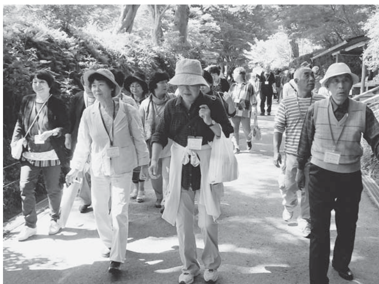
▲月見坂を散策♪天気も良く心地よい一日でした。