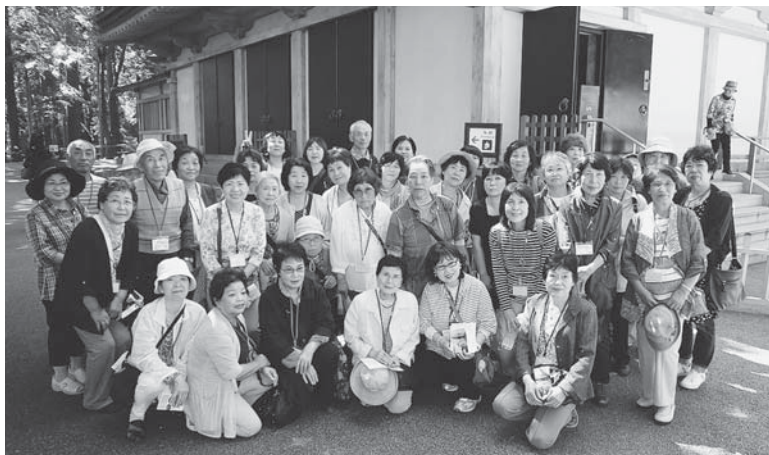
▲金色堂の前にて参加者全員で記念撮影♪

毎年、この時期のつどいは日帰り小旅行を実施しており、今回は世界遺産にも登録された「平泉」を訪れ、中尊寺や厳美溪を巡り、参加された42名の皆さんは、癒しのひとときを過ごしました。