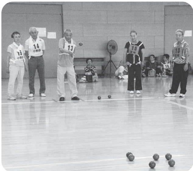
▲勝負を決める1投! 両チーム注目の球の行方は…??