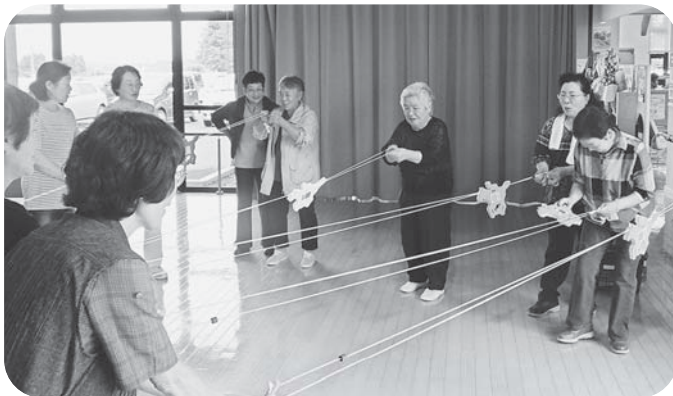
▲勝負は横一線！小野田ダービーはどの馬が優勝!? (競馬でGO)

8月30日、小野田福祉センターを会場に、各行政区で行われているミニデイサービスのリーダーや区長、民生委員を対象としたミニデイサービスレクリエーション研修会を開催し、50名の皆さんが参加されました。