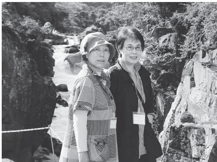
▲厳美溪のすばらしい景観をバックにパシャッ!!

中尊寺は月見坂を上ると、本堂や讃衡蔵など見どころがたくさんありますが、やはり参加者の皆さんの一番のお目当てはまばゆい輝きを放つ『金色堂』でした。金箔と螺鈿細工の工芸技術が集約された御堂に、皆さん見入っている様子が印象的でした。金色堂を拝観後は散策やお土産を買うなど、皆さん思い思いに過ごされていました。