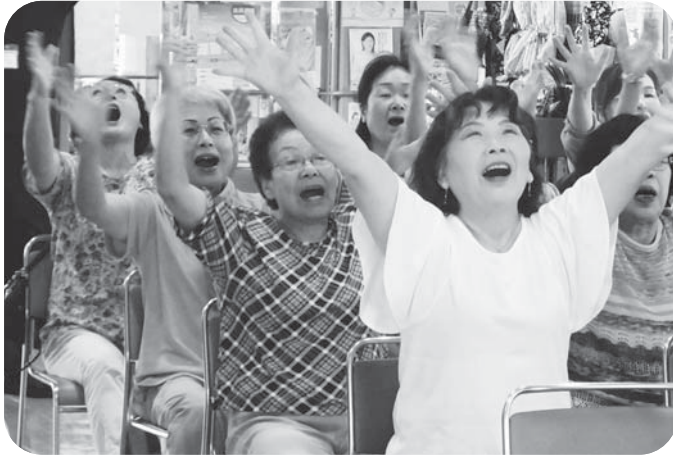
▲軽体操では小さく体を丸めてから、「大きくなって～！」の合図でパッと解放！全身を使って皆さん良い笑顔です♪