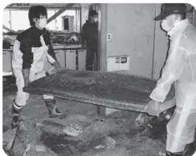
▲水を吸んだ畳は相当な重さに