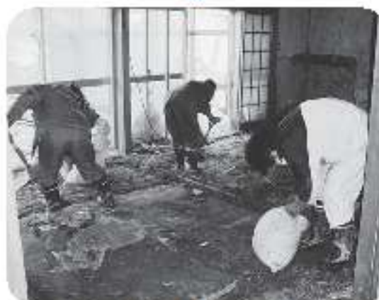
▲2時間かけてようやく一部屋の片付けが完了