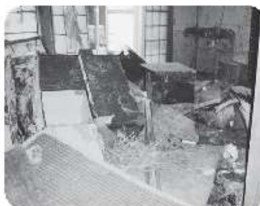
▲建物内はタンスや畳などが散乱