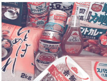
家庭や企業などから食品の寄付