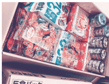
食べる物が無くて困っている方に提供