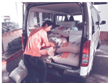
フードバンクで食品管理し県内の依頼を受けた機関や団体に提供