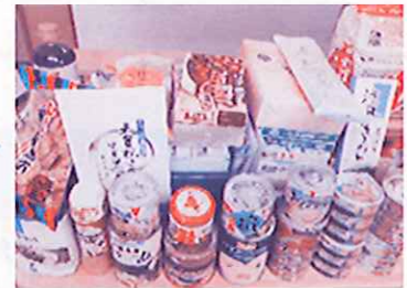
食べる物が無くて困っている方に提供