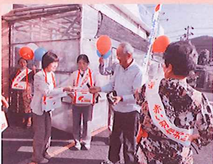
街頭募金のような

12月25日 スポーツ吹矢教室 日程が変更になる場合があります。詳しくは社協までお問い合わせください。