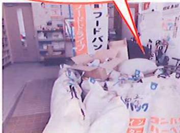
家庭や企業などから食品の寄付