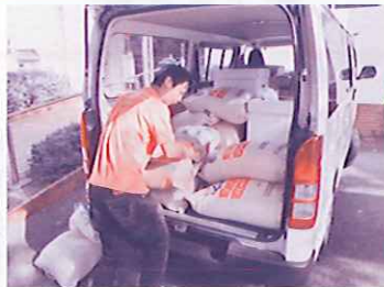
フードバンクで食糧管理し県内の依頼を受けた機関や団体に提供