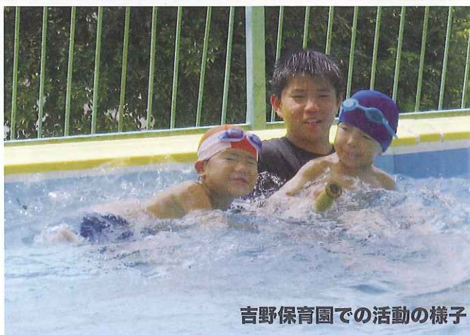
吉野保育園での活動の様子