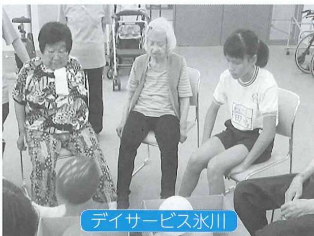
デイサービス氷川