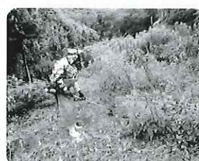
草刈り作業の様子 (伊方地区)