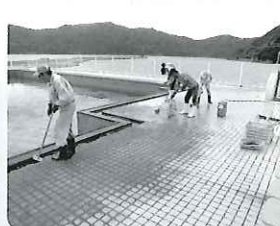
プール清掃の様子 (瀬戸地区)