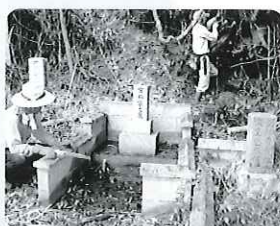
お墓掃除の様子 (瀬戸地区)