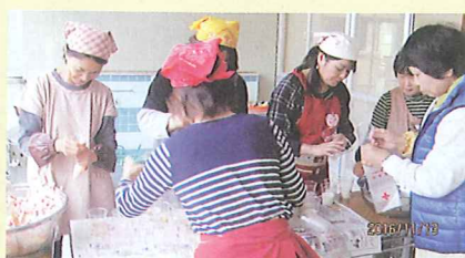
白川地区(金峰) 公民館まつりでの炊出し風景