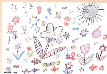
利用者さまのアート作品 (施設パンフの表紙です。)