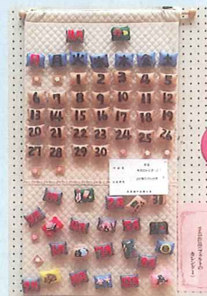
老連会長賞 上村東たのしみ会

11月20日（日）、健幸ふれ愛フェスタの開催に伴い、さまざまな催しが行われました。市民会館大ホールでは、ステージイベントとしてボランティア連絡会より2団体の発表をいただきました。その後、表彰式が行われ、まず永年にわたり社会福祉に功労・功績のあった個人17名、1団体へ社会福祉協議会長賞の授賞式があり、次に高齢者作品展の優秀賞として、個人2名、1団体に対して各賞が贈られました。