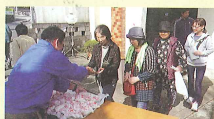
白亀自治会(加世田) 自主防災訓練での炊出し風景