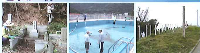
お墓掃除の様子 プール清掃の様子 草刈り作業の様子