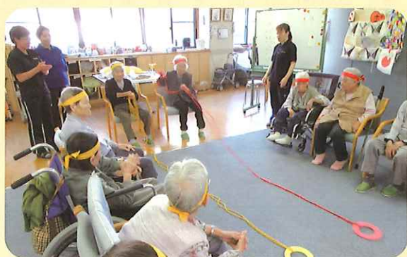
レクリエーション