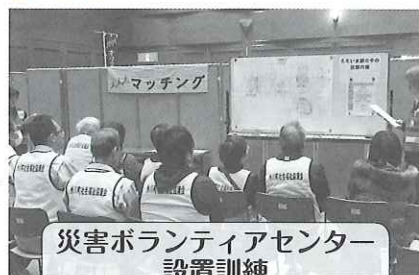
災害ボランティアセンター 設置訓練