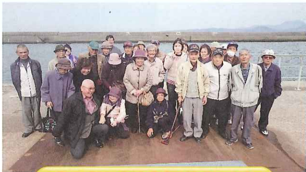
ふれあい交流会(天草市五和)

氷川町身障者福祉会では新規会員を募集しています。対象者は氷川町内にお住まいの身体障害者手帳又は療育手帳、精神保健福祉手帳をお持ちの方、年齢・性別を問わずどなたでも入会できますので、皆さまのご参加を心よりお待ちしております。