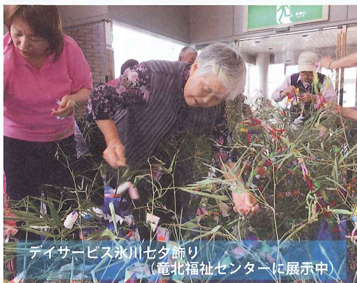
デイサービス氷川七夕飾り (竜北福祉センターに展示中)