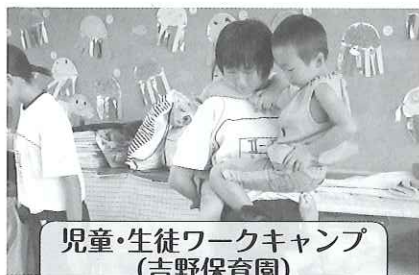
児童・生徒ワークキャンプ (吉野保育園)