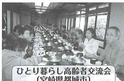
ひとり暮らし高齢者交流会 (宮崎県都城市)