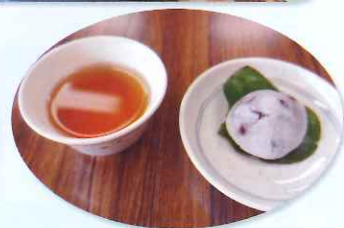
手作りおやつの柏餅

ふれあいデイサロンを「見学してみたい」「参加したい」などのご希望の方は、右記までご連絡ください。