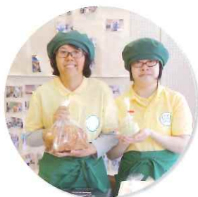
サンフル工房 ひだかのパンも 販売しています

初めまして。今年の2月から訪問介護のスタッフとして勤務しています。 少しでも利用者様のお役に立てたらと、毎日一生懸命頑張っています。 どうぞ宜しくお願いいたします。