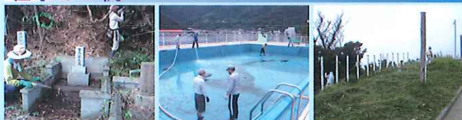
お墓掃除の様子 プール清掃の様子 草刈り作業の様子