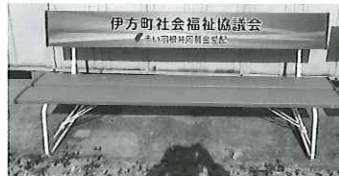
町内での使い道 公園等へのベンチ設置など