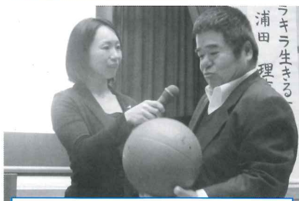
競技用ボールを持たれた感想は？