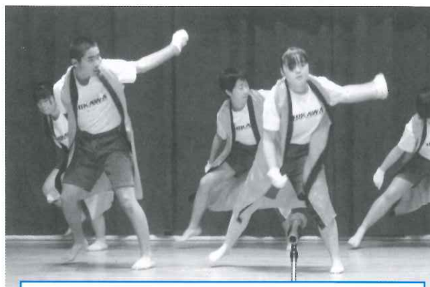
氷川ソーラン（氷川中学校）