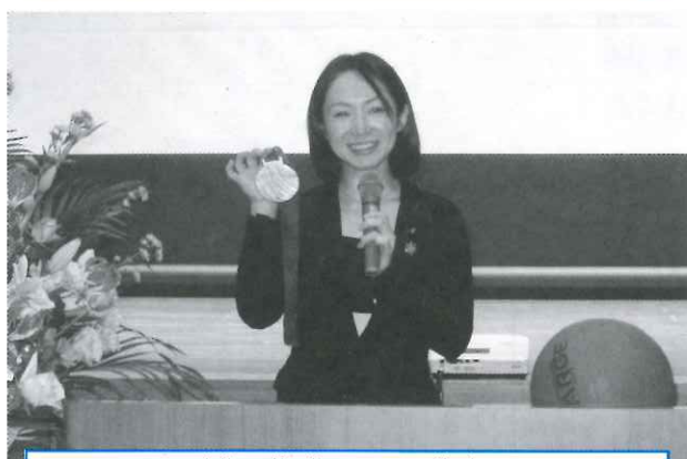
浦田先生による講演