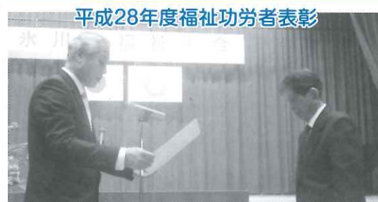
平成28年度福祉功労者表彰