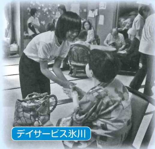
デイサービス氷川