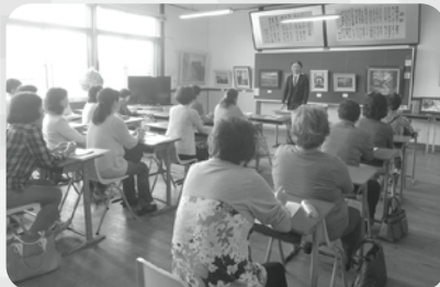
支配人様より 「障がいについて」の講話