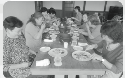
レストランにて昼食