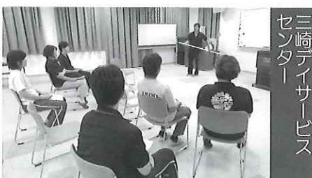
三崎老人デイサービスセンター

社会福祉協議会が運営する各デイサービスセンターにおいて、神奈川県相模原市の障害者支援施設での殺傷事件を踏まえ、通所者の安全対策を強化する為、防犯訓練を実施しました。