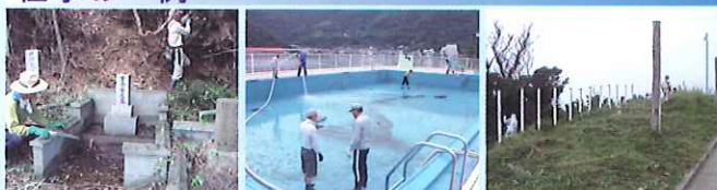
お墓掃除の様子 プール清掃の様子 草刈り作業の様子