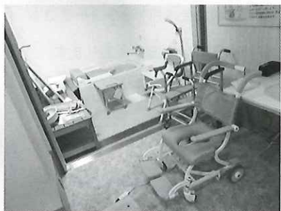
シャワーチェアなど (浴室改造例)

実際に、福祉用具の利用の体験、見て、触って、試すこともできますので、お気軽にご参加ください。