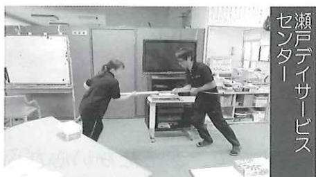
瀬戸老人デイサービスセンター