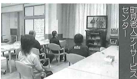
町見老人デイサービスセンター