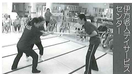
伊方老人デイサービスセンター