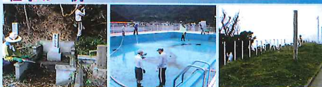
お墓掃除の様子 プール清掃の様子 草刈り作業の様子