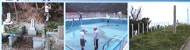
お墓掃除の様子 プール清掃の様子 草刈り作業の様子