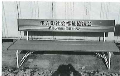
町内での 使い道 公園等へのベンチ 設置など