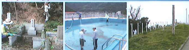
お墓掃除の様子 プール清掃の様子 草刈り作業の様子