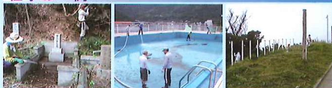
お墓掃除の様子 プール清掃の様子 草刈り作業の様子