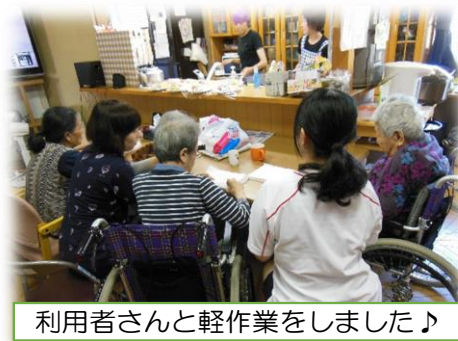
利用者さんと軽作業をしました♪