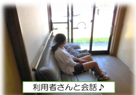
利用者さんと会話♪