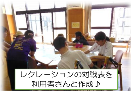
レクリエーションの対戦表を 利用者さんと作成♪