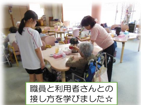
職員と利用者さんとの 接し方を学びました☆