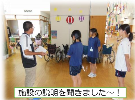
施設の説明を聞きました～！