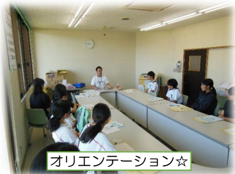
オリエンテーション☆