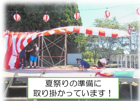
夏祭りの準備に 取り掛かっています！