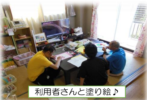
利用者さんと塗り絵♪