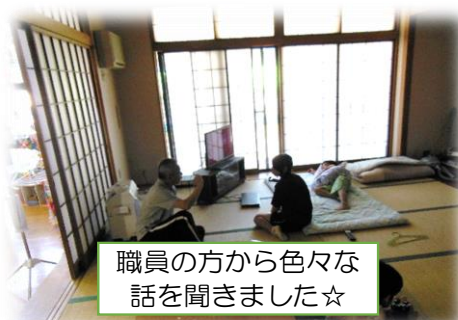
職員の方から色々な 話を聞きました☆