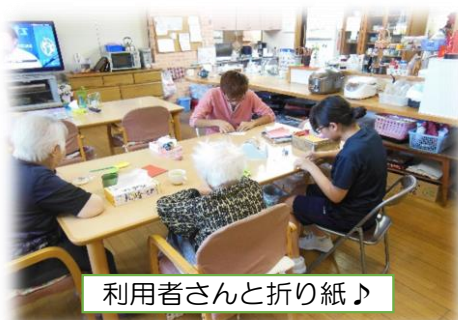
利用者さんと折り紙♪