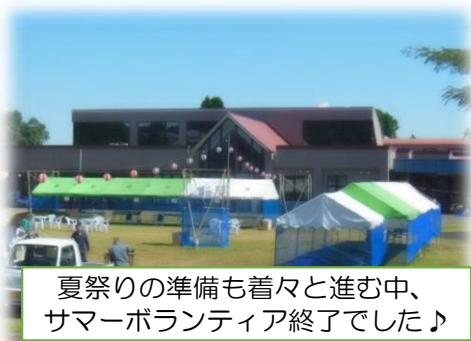
夏祭りの準備も着々と進む中、 サマーボランティア終了でした♪

このサマーボランティアで体験し学んだことを大切に、日々の生活を送っていただければと思います。参加された生徒の皆様、お疲れ様でした！