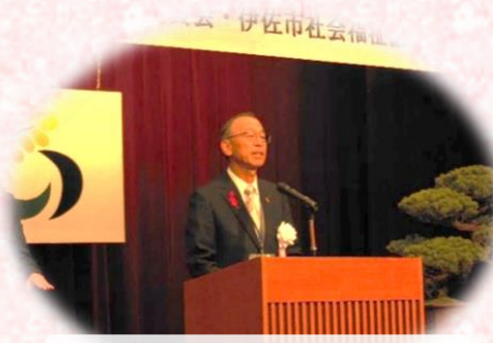
大会会長(隈元市長)あいさつ