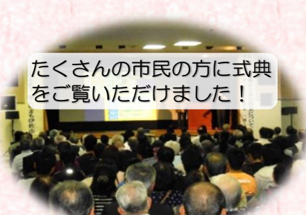
たくさんの市民の方に式典 をご覧いただきました！