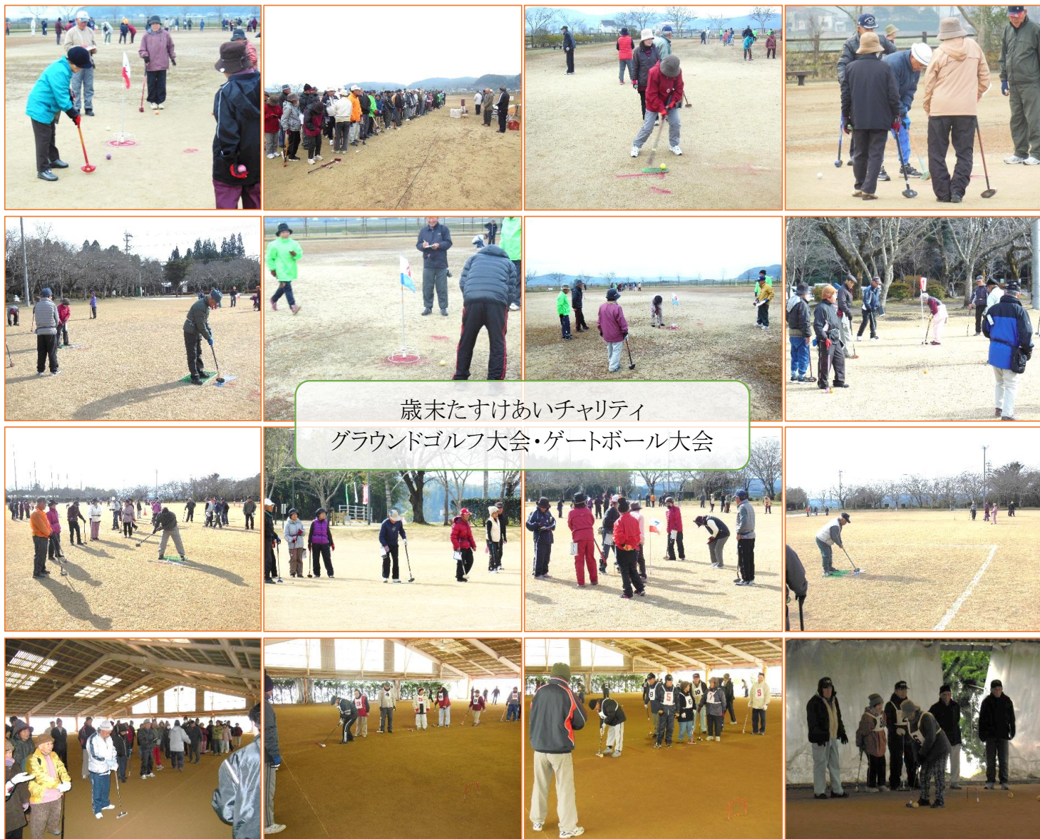
歳末たすけあいチャリティ グラウンドゴルフ大会・ゲートボール大会