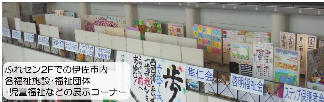
ふれセン2Fでの伊佐市内 各福祉施設・福祉団体 ・児童福祉などの展示コーナー