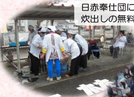
日赤奉仕団による 炊出しの無料配布