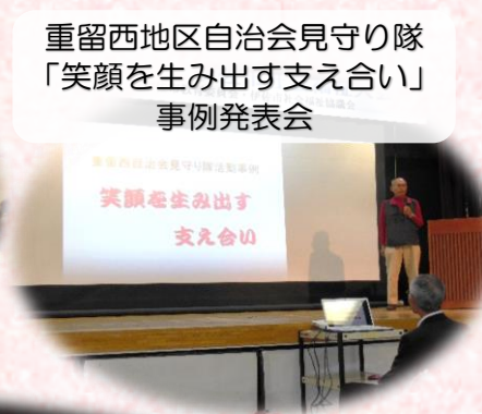
重留西地区自治会見守り隊 「笑顔を生み出す支え合い」 事例発表会