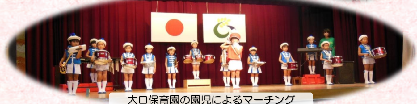
大口保育園の園児によるマーチング