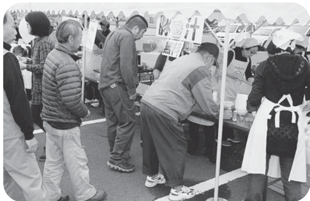
▲無料の豚汁は具だくさんで大好評♪ 今年も食生活改善推進委員会の皆さんに感謝!!