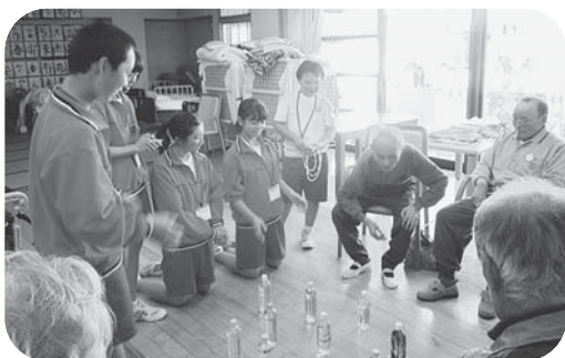
▲輪投げに挑戦！表情は真剣そのもの!!