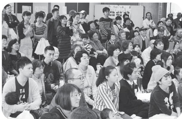
▲開会式は立ち見が出るほどの「満員御礼」

当日は時折雨の降るあいにくの天気でしたが、多数の皆様にご来場いただきました。今年もご来場ならびにご協力いただいた皆様、大変ありがとうございました。