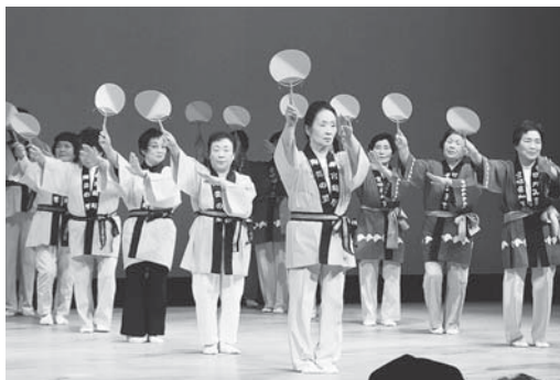
▲東京エレクトロンホール宮城でも披露した艶やかな加美町音頭（老人クラブのつどい）