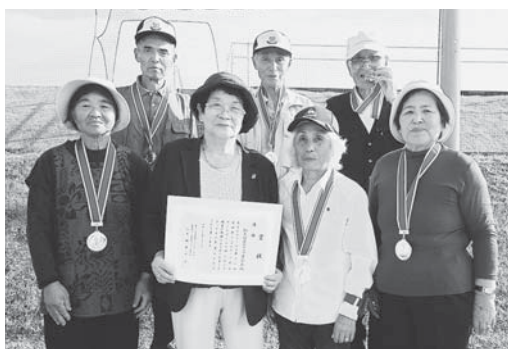
▲宮城県シニアスポーツ大会では、ゲートボールで一昨年に続いて2度目の表彰台!!