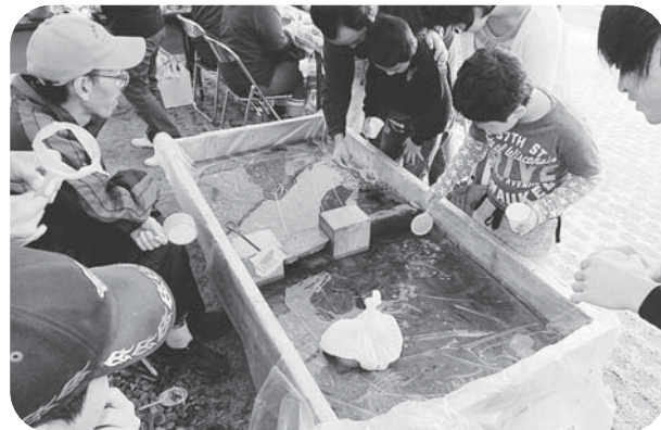
▲クローバーハウス恒例、大人気コーナーの 「魚すくい」。中には金魚ではなくザリガニも!?