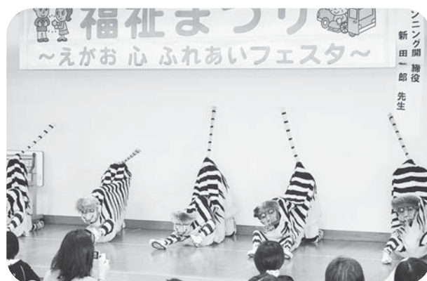
▲今年の福祉まつりは中新田幼稚園の虎舞で開幕