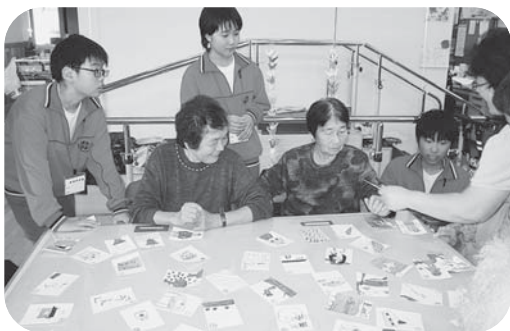
▲手作りのカルタに感心する利用者の皆さん。

10月8日、宮崎中学校1年生28名の皆さんが、ボランティア体験学習の一環として、宮崎デイサービスセンターに来てくださいました。