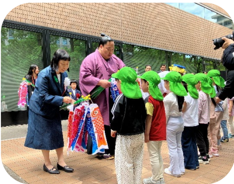
ミニこいのぼりのプレゼントの様子

当日は天候にもめぐまれ、子どもたちと参加者が力をあわせてこいのぼりを掲揚し、青空のなかを元気に泳ぐこいのぼりの姿が見られました。