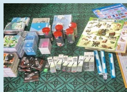
全社協からの支援で用意した教材や文具