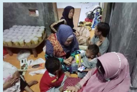
シェルターで生活する女性と子ども

虐待や暴力被害を受ける女性や子どもを保護する施設はインドネシアに少なく、サクラ財団のシェルター事業は行政から一定の理解を得ています。サクラ財団では、保育園運営や食糧販売事業により得た収入をシェルターの運営に充てていました。ところが、新型コロナウイルスのパンデミックにより、どちらの事業も政府から実施を禁止され、シェルター運営費が賄えなくなりました。財団では政府の助成を申請しましたが、助成が下りるのは半年以上先で、そのうえ食費や日常生活費は対象になりません。財団のスタッフは無給で業務にあたりましたが、シェルターで受け入れている女性11名と子ども33名の食費や生活費が賄えないため、全社協に対して緊急の資金支援が要請されました。全社協では国際社会福祉基金委員会の了承を得て、シェルターの維持・運営に必要な費用の6か月相当分として、35,800,000インドネシアルピア（270,182円）を支援しました。