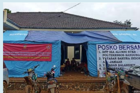
サクラ財団による難民キャンプ