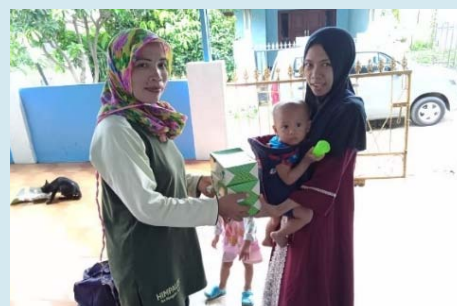
親子への食糧支援

行政と協力した食糧パッケージの配布や、オンライン授業のためのインターネット環境の整備、パンデミックにより家庭内暴力を受けた子どもへの心理的・社会的支援も行いました。