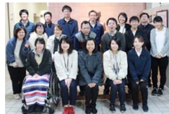
ニーさん(タイ・36期)と研修センター職員